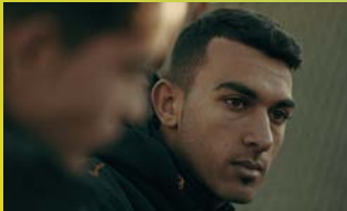
کباتن الزعتري Captains of Zaatari Mit with Diversity Talk