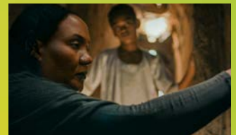
سموت في العشرين Mit 20 wirst Du sterben Online auf der Streamingplattform DFF Kino+