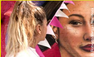
VIVAS Mit with Film Talk