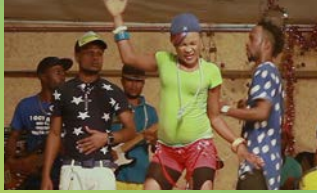
RUMBA RULES NOUVELLES GÉNÉALOGIES Rumba Rules New Genealogies