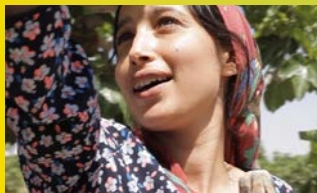
تحت الشجرة Under the Fig Trees Mit with Diversity Talk