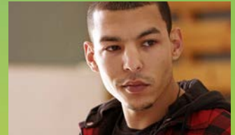
علی صوتک Casablanca Beats