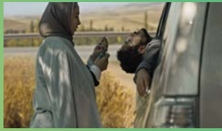
جاده خاکی Hit the Road Mit with Diversity Talk