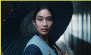
NANA Before, Now and Then