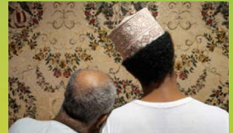
DON'T GET TOO COMFORTABLE