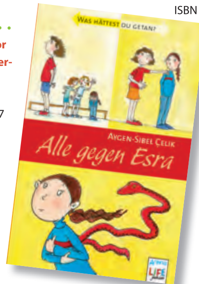
Illustration: Aygen-Sibel Çelik aus: Alle gegen Esra , Arena Verlag

Fabrizio Silei, Maurizio A. C. Quarello Verlag: Jacoby & Stuart Erscheinungsjahr: 2011 Preis: 14,95 € ISBN 978-3941787407