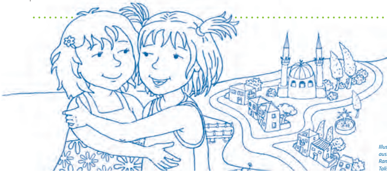
Illustration: Sibel Demirtaş aus: Leyla und Linda feiern Ramadan – Unterrichtsmaterial, Talisa Verlag

Es ist dann Aufgabe der Eltern und pädagogischen Fachkräfte, hier bewusst gegen zu steuern und die Kinder zu stärken.